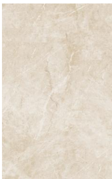
Este producto contiene 4 caras.