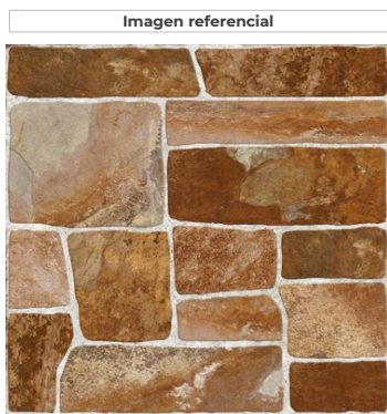
Este producto contiene 1 cara