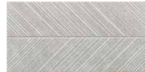
30x60 | 11 7/8 "x23 1/2 " FJ0163LI Ice Lisca