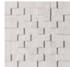
30x30 | 11 7/8 "x11 7/8 " FJ013MD Ice Mosaico 3D ● Pcs Box 9