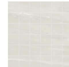
30x30 | 11 7/8 "x11 7/8 " FJ013MA Ice Mosaico ● Pcs Box 12