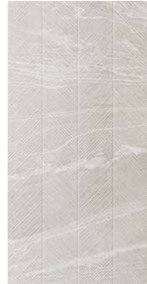
120x60 | 47 1/4 "x23 1/2 " FJ01BALI Ice Lisca