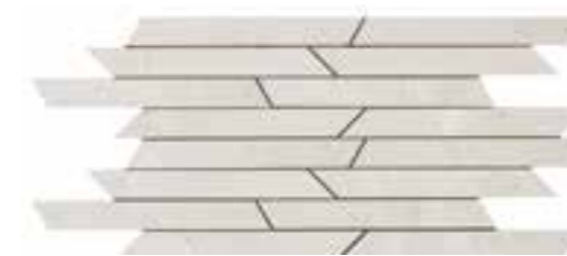
30x55 | 11 7/8 "x21 5/8 " FJ01MB Ice Muretto ● Pcs Box 6