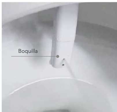
Función de lavado delantero o trasero de modo manual o automático. (3 opciones de temperatura del agua)