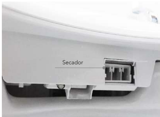
Función de secado con aire caliente. (5 opciones de temperatura)