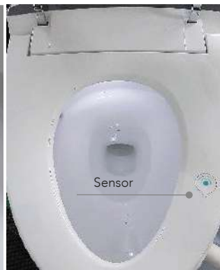
Área de sensado por presión para la activación del sistema. Función de luz nocturna incorporada.